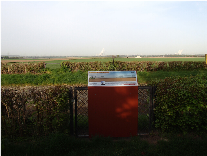
Erzählstation "Panorama Sinnersdorf" am Kölner Randkanal (2014)