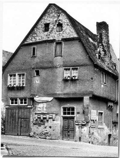
Das Fachwerkhaus Hauptstraße 88 in Briedel, die sogenannte "Alte Grafschaft" (1930er Jahre).