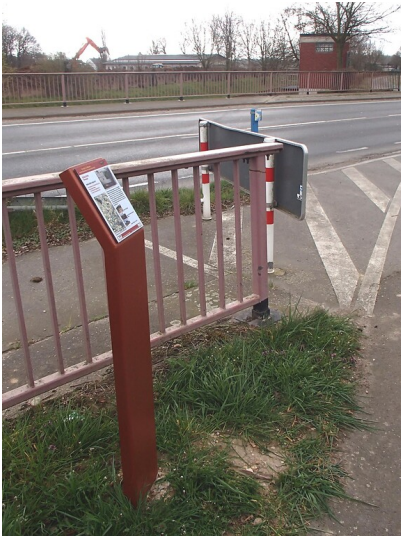
Erzählstation "Messpegel" am Kölner Randkanal (2013)