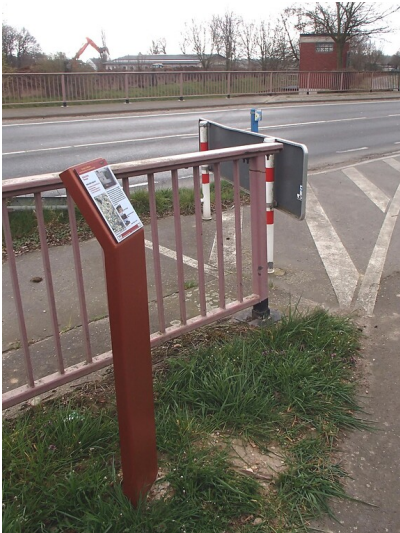
Erzählstation "Messpegel" am Kölner Randkanal (2013)