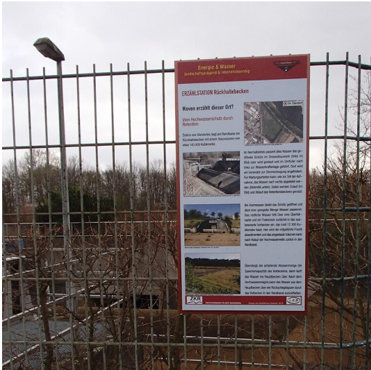
Erzählstation "Rückhaltebecken" am Kölner Randkanal (2014)