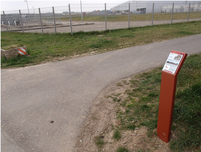
Erzählstation "Regenwasserbehandlung" am Kölner Randkanal (2014)