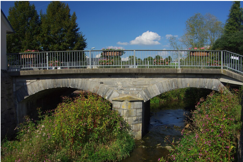
Lahnmarmorbrücke in Eschenau (2020)