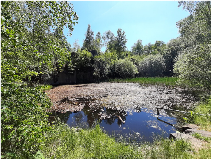
Blick auf den Silbersee im Mayener Grubenfeld (2020).