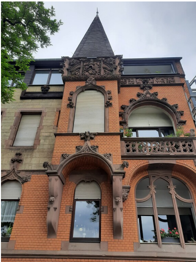
Haus Blumenstraße 8 in Koblenz-Lützel (2020).