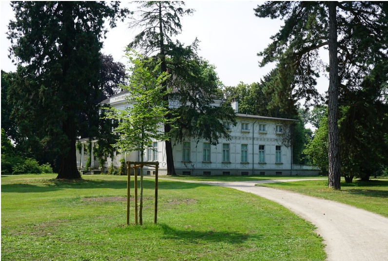
Haus Lantz in Düsseldorf-Lohausen, Ansicht von Nordost (2018)