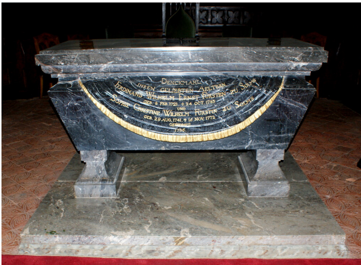
Altar in der Schlosskirche Braunfels (2020)