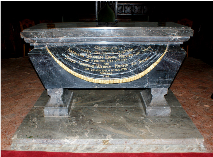
Altar in der Schlosskirche Braunfels (2020)