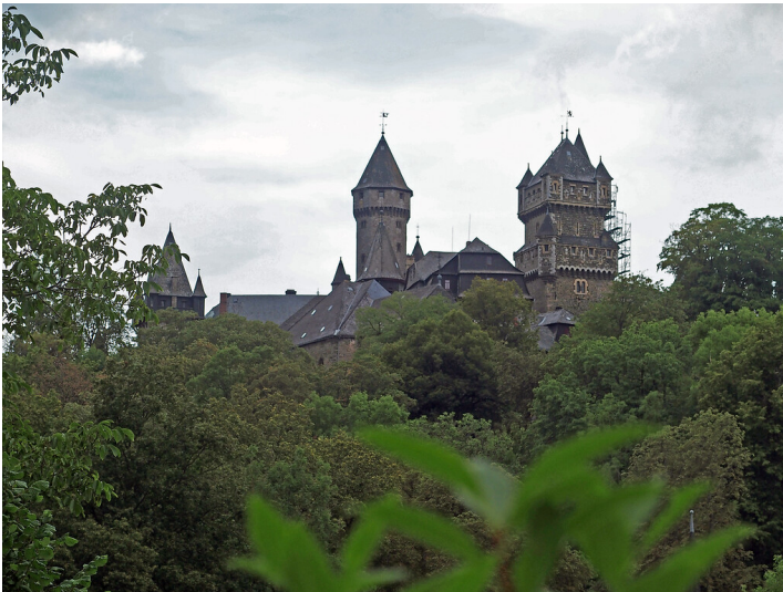
Schloss Braunfels (2020)