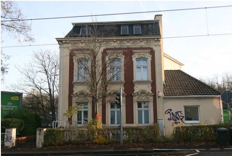
Villa des Steinzeugfabrikanten Tillmann Vogt an der Dürener Straße in Frechen (2021)