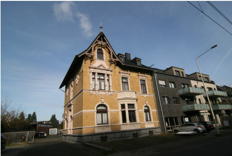
Villa des Steinzeugfabrikanten Weiden an der Kölner Straße in Frechen (2021)