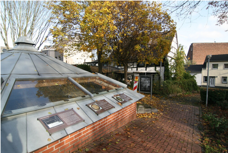
Ensemble aus überdachten Töpferöfen und zugehörigem Wohnhaus in Fachwerkbauweise in der Broichgasse (2021)