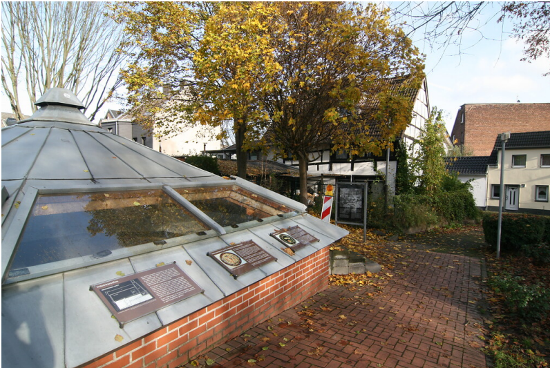
Ensemble aus überdachten Töpferöfen und zugehörigem Wohnhaus in Fachwerkbauweise in der Broichgasse (2021)