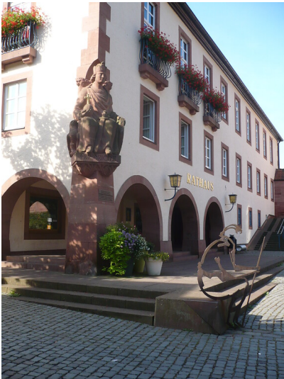
Blick auf die Gebäudeecke des Rathauses Annweiler mit der Skulptur Friedrich II. aus dem Geschlecht der Staufer (2020)