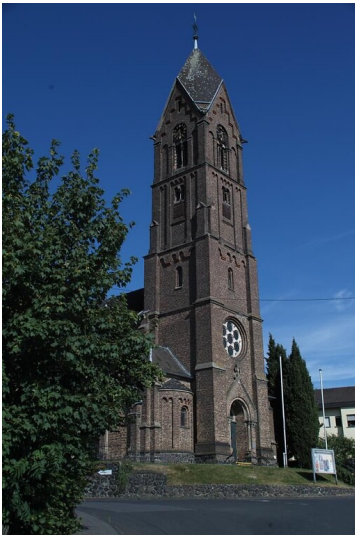
Blick auf die Pfarrkirche Heilige Schutzengel in Dattenberg (2020).