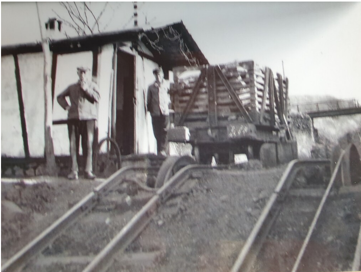
Abfahrt der Bremsbahn von Dattenberg aus den Stürzberg hinunter (1930er Jahre).