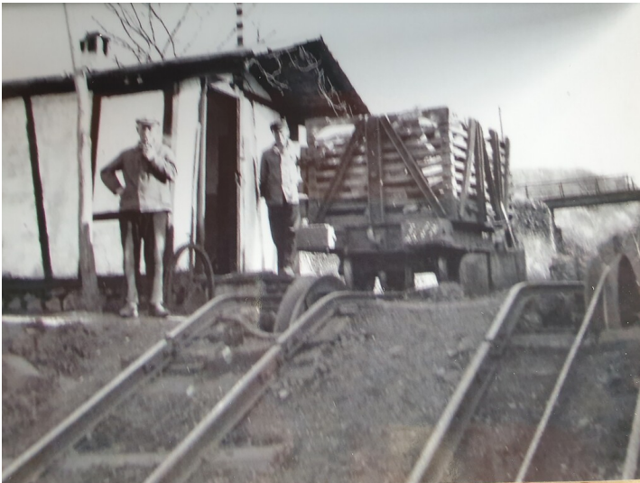
Abfahrt der Bremsbahn von Dattenberg aus den Stürzberg hinunter (1930er Jahre).