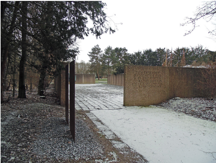
Blick auf die Gesamtanlage des Gräberfelds für deutsche und ausländische Opfer des Nationalsozialismus auf dem Westfriedhof in Köln-Vogelsang (2021).