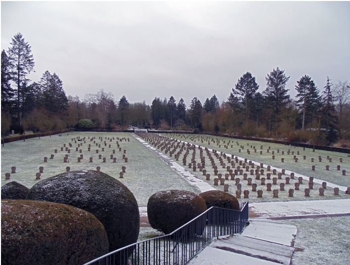
Blick über das Gräberfeld für deutsche Kriegsoffer auf dem Westfriedhof in Köln-Vogelsang von Westen aus gesehen (2021).