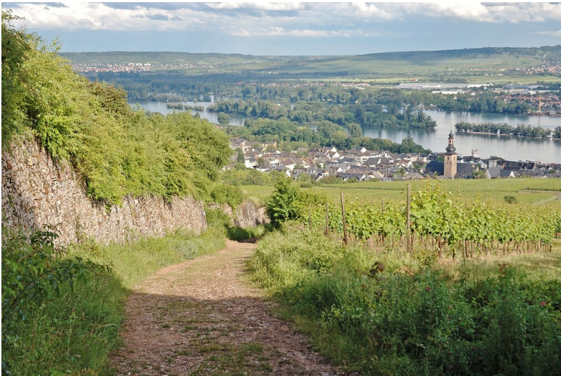
Rüdesheimer Kuhweg (2008)