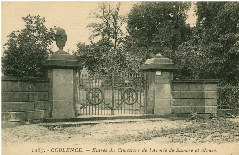
Historische Postkarte des Eingangs zum Friedhof französischer Soldaten in Koblenz-Lützel (gelaufen um 1929).