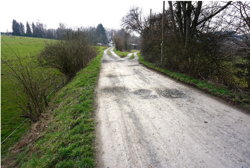
Trasse der Feldbahn in Müllenbach (2021) - Rechts die Trasse nach Obernhagen, links der Abzweig zum Betriebshof