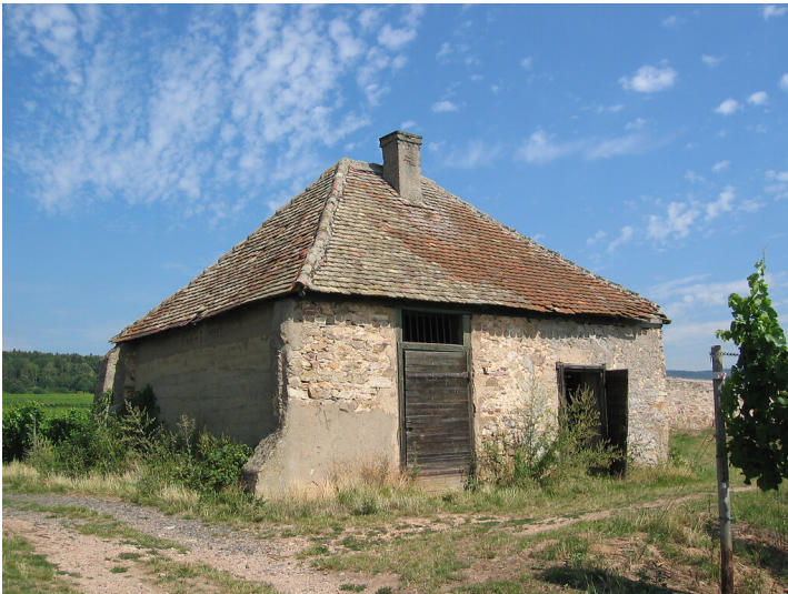
Weinberg "Dachsberg" in Oestrich-Winkel (2004)