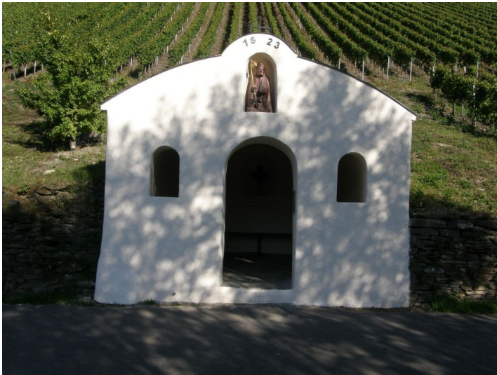
Fährhäuschen gegenüber der Ortsgemeinde Briedel (2005)