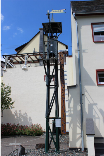
Fährturm an der Moselstraße in Briedel (2020)