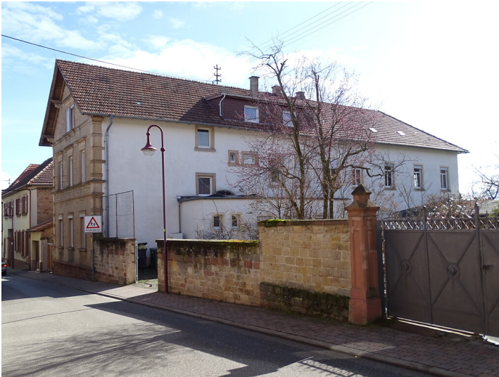
Hartmannstraße 45 Maikammer (2020).