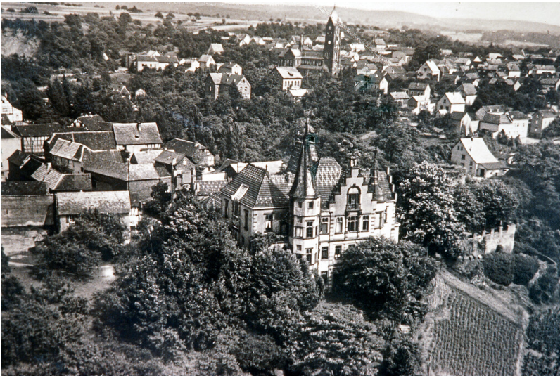
Blick auf die Ortsgemeinde Dattenberg (1950er Jahre).