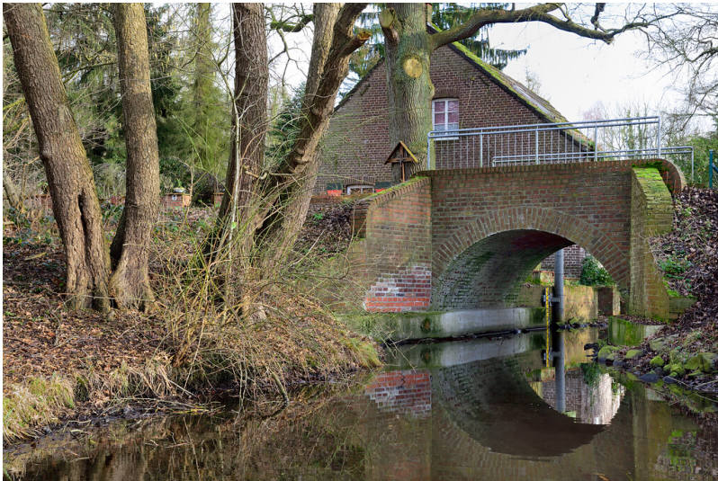
Brücke zur Floomühle in Nettetal (2020)