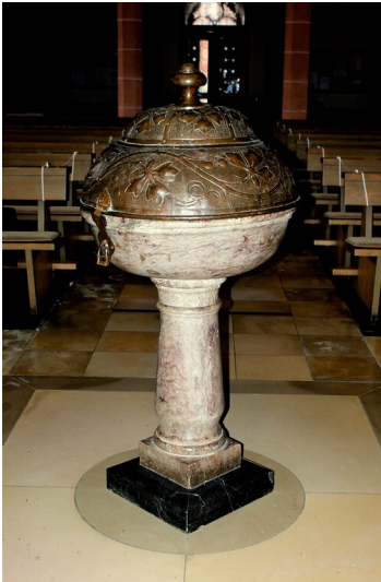
Taufbecken im Mittelschiff der Pfarrkirche St. Johannes der Täufer in Elz (2020)