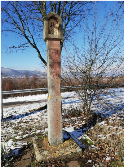
Bildstock mit Katharinenbild Kirrweiler (2021)