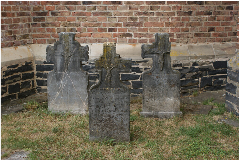
Grabkreuze auf dem Kirchhof der Pfarrkirche St. Ägidius in Obertiefenbach (2020)