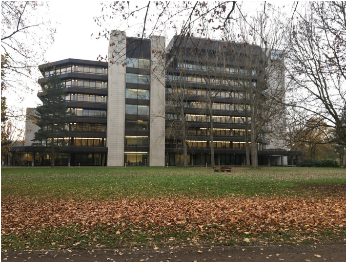
RWE Power, ehem. Rheinbraun-Zentrale (2020)