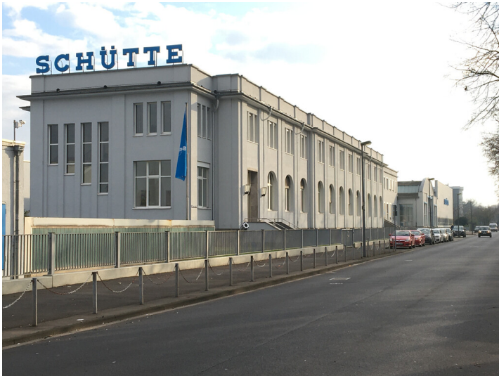
Alfred H. Schütte Werkzeugmaschinen (2020)