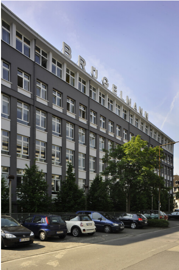
F. W. Brügelmann Söhne, Fabrik Deutz (2012)