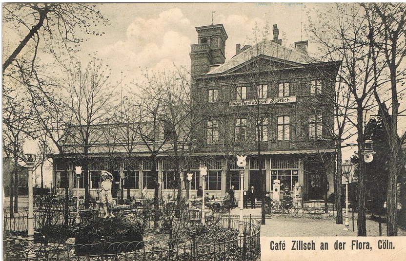
Historische Postkarte (um 1915): Ansicht der seit 1902 als "Café Zilisch" geführten Gastronomiebetriebs (zuvor "Café Maus") nahe des Zoologischen Gartens und des Botanischen Gartens "Flora" in Köln-Riehl.