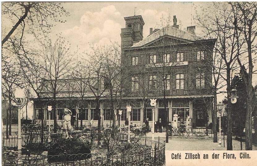
Historische Postkarte (um 1915): Ansicht der seit 1902 als "Café Zilisch" geführten Gastronomiebetriebs (zuvor "Café Maus") nahe des Zoologischen Gartens und des Botanischen Gartens "Flora" in Köln-Riehl. Fotograf/Urheber: unbekannt