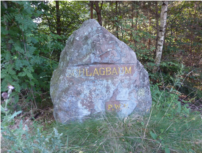
Ritterstein Nr. 180 Schlagbaum südöstlich von Alsenborn an der A6 (2014)