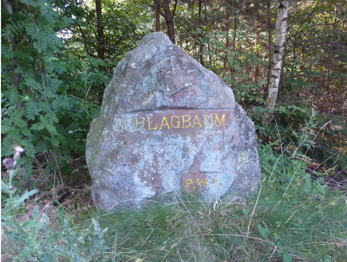
Ritterstein Nr. 180 Schlagbaum südöstlich von Alsenborn an der A6 (2014)