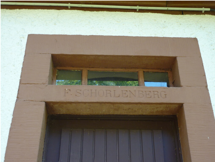
Ritterstein Nr. 179 F. Schorlenberg nordöstlich von Fischbach (2014)