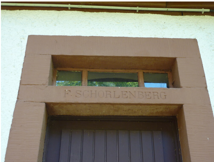
Ritterstein Nr. 179 F. Schorlenberg nordöstlich von Fischbach (2014)