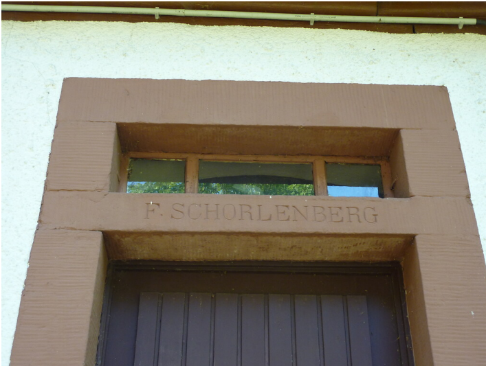
Ritterstein Nr. 179 F. Schorlenberg nordöstlich von Fischbach (2014)