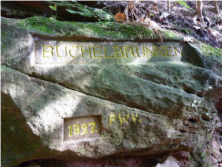
Ritterstein Nr. 178 Buchelbrunnen 1927 nordöstlich von Fischbach (2014)