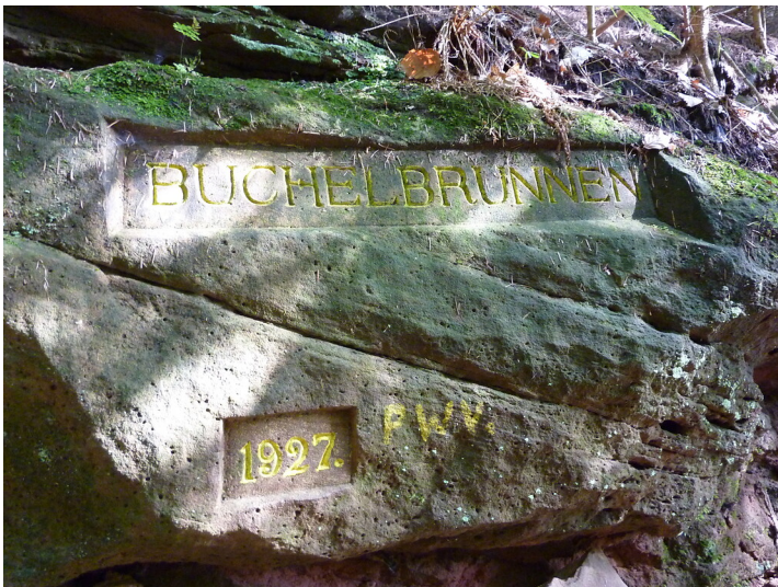
Ritterstein Nr. 178 Buchelbrunnen 1927 nordöstlich von Fischbach (2014)