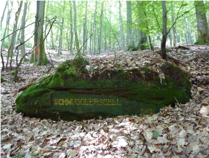
Ritterstein Nr. 177 Schmugglersdell nordöstlich von Fischbach (2014)