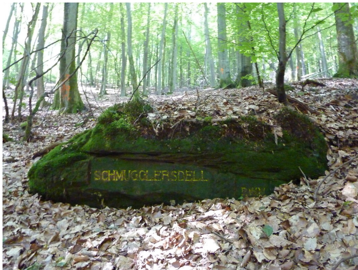
Ritterstein Nr. 177 Schmugglersdell nordöstlich von Fischbach (2014)