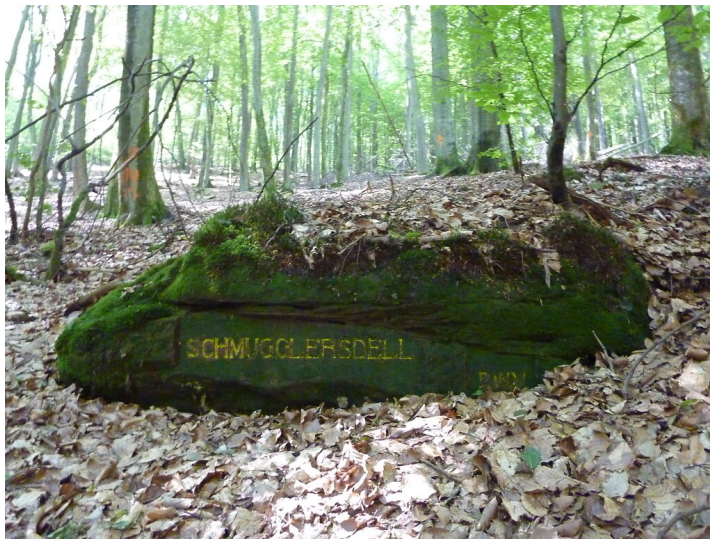
Ritterstein Nr. 177 Schmugglersdell nordöstlich von Fischbach (2014)