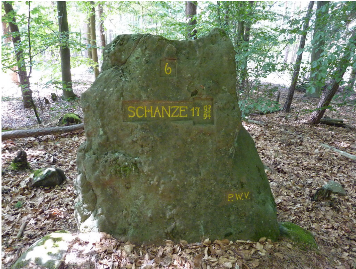
Ritterstein Nr. 175 6 Schanze 1793/94 nordöstlich von Fischbach (2014)