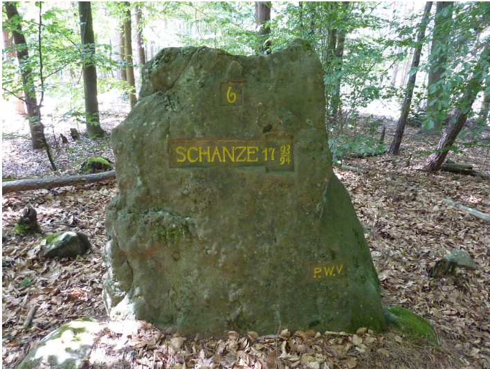
Ritterstein Nr. 175 6 Schanze 1793/94 nordöstlich von Fischbach (2014)