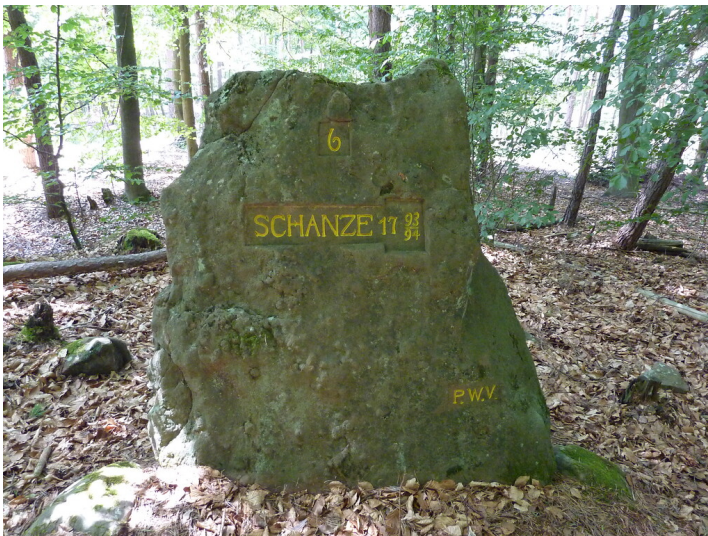
Ritterstein Nr. 175 6 Schanze 1793/94 nordöstlich von Fischbach (2014)