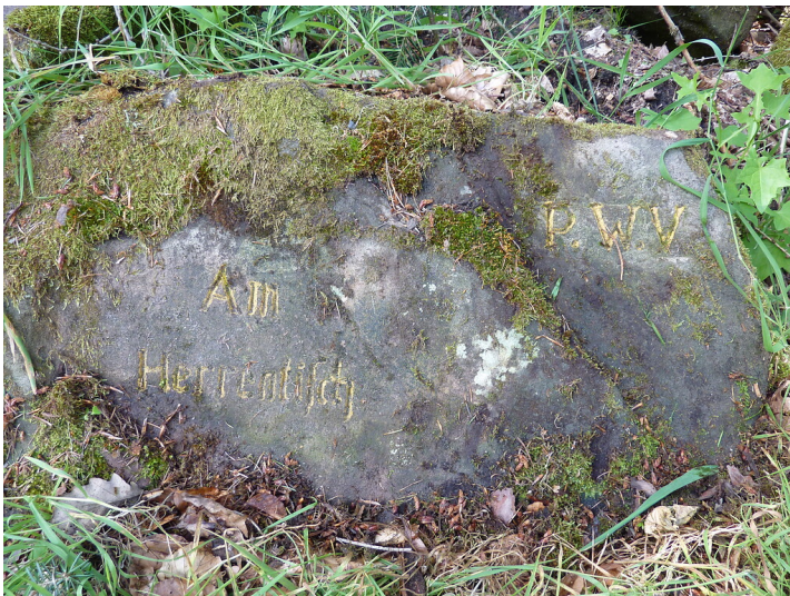
Ritterstein Nr. 129 Am Herrentisch westlich von Neidenfels (2013)