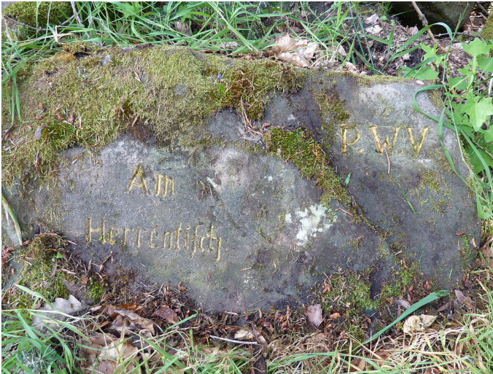
Ritterstein Nr. 129 Am Herrentisch westlich von Neidenfels (2013)