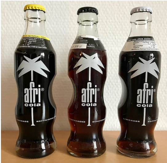
Drei 0,2-Liter-Flaschen der Limonade "Afri Cola" mit der typischen Einkerbung (2018).