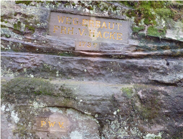
Ritterstein Nr. 122 Weg erbaut Frh. v. Hacke 1737" zwischen Johanniskreuz und Elmstein (2014)